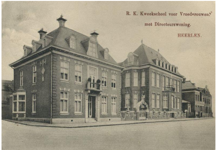
Vroedvrouwenschool aan de Akerstraat

de aanzet geweest tot de oprichting van de R.K. Vereniging “Moederschapszorg” in 1909 en de bouw van een kweekschool voor vroedvrouwen. Het was de bedoeling dat de school in Maastricht zou worden gevestigd, maar het gemeentebestuur van Maastricht trok daar niet zo aan. De gemeente Heerlen was toeschietelijker met een financiële bijdrage. De school werd aan de Akerstraat direct naast het Sint Josephziekenhuis gebouwd.