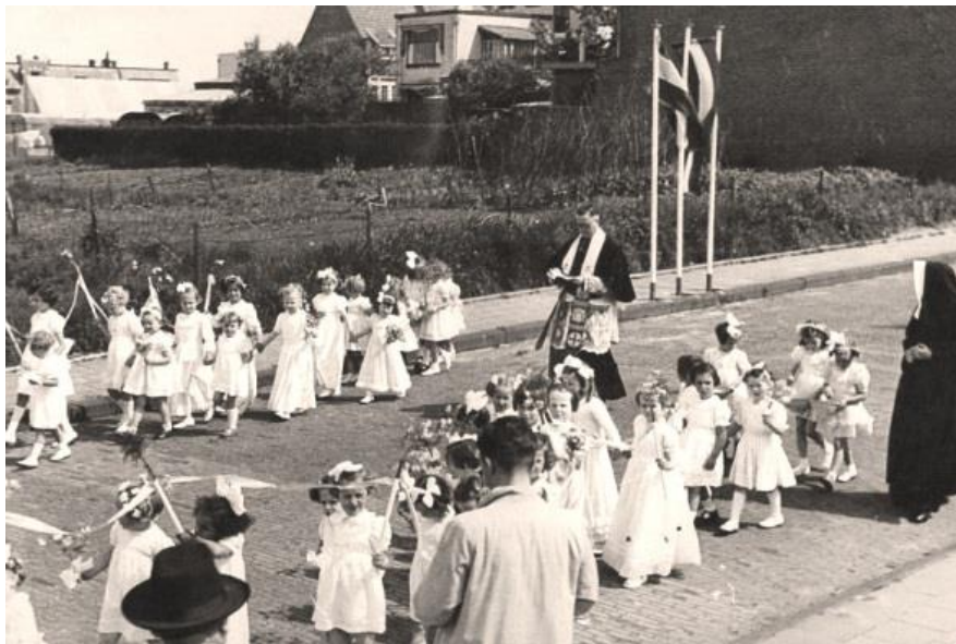
Foto oude situatie, precessie in de Deken Nicolayestraat