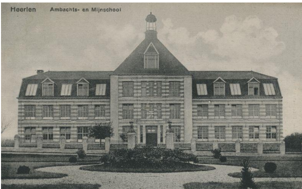
Ambachts- en Mijschool 1924

In 1913 werd de Ambachtsschool zoals we het gebouw nu nog kennen aan het Burgemeester de Heseleplein gebouwd. Dat heet, pas een deel van het gebouw kwam in dat jaar tot stand, want het totale gebouw werd in vier fasen gebouwd en was pas in 1920 geheel klaar. De Vereniging Ambachts- en Mijschool voor Heerlen en Omstreken was de opdrachtgever. In 1913 had men een stuk grond ter grootte van 6500 m 2 gevonden in het Lindeveld. Het grootste deel van dit perceel was in handen van de heer Honigmann directeur eigenaar van de Oranje Nassaumijn. Aan de verkoop van de grond werd door hem de voorwaarde verbonden dat er een school op gebouwd zou worden en dat de gemeente voor de aanleg van de daarom heen liggende straten zou zorgen. De gemeente ging in