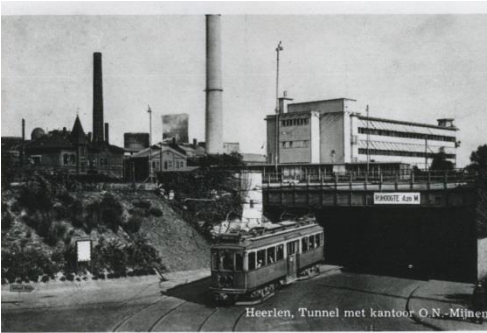
Tram komt uit de tunnel

tunnel ten westen van het station die op genoemde datum in gebruik genomen werd. Deze tunnel in moderne vorm is nu de tunnel bij het CBS naar de Looierstraat. De tram uit Sittard kon daardoor het station en het centrum van Heerlen op een gemakkelijker manier bereiken. Het zogenaamde overzetten was nu niet meer nodig en vanuit de remise ging men niet meer de Sittarderweg in maar de Kloosterweg langs de hoofdingang van de Oranje-Nassaumijn I de nieuwe tunnel in.