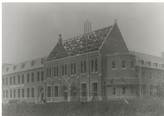
Het Bernardinuscollege in aanbouw