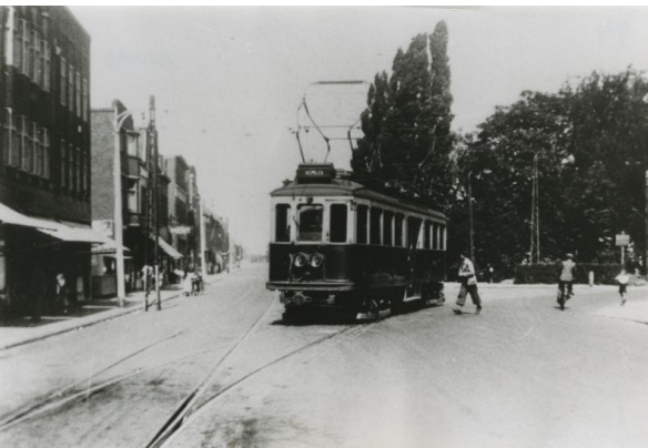
Tram nr 610 in bedrijf in 1949

H. Schreuders en S.J. de Lange, Uitgever Waanders Zwolle 1993