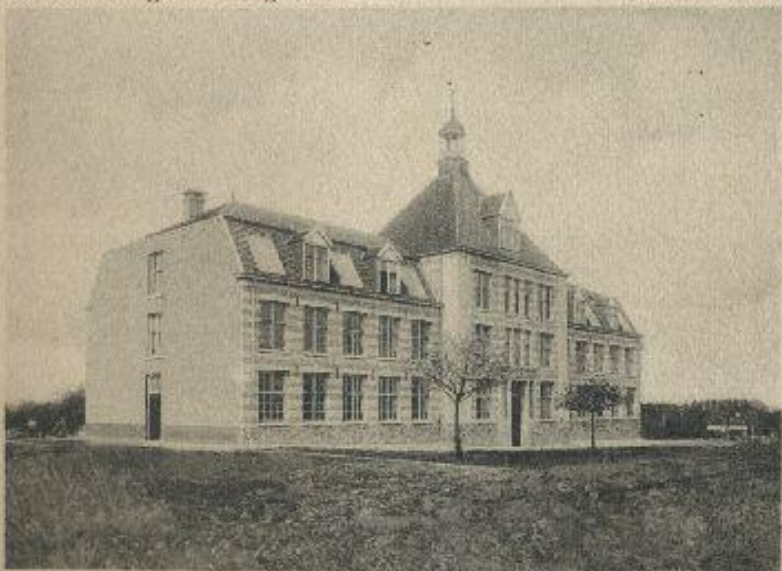
Ambachts- en Mijnschool.