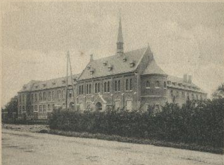
R. K. Hoogere Burgerschool.