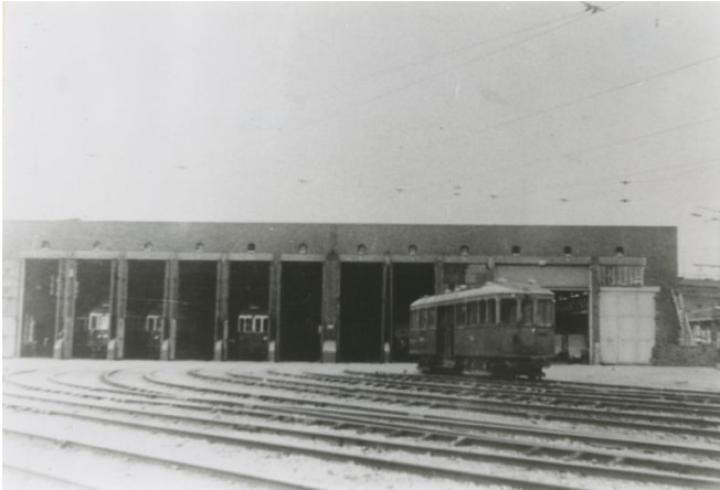
Tramremise met opstelrein

De remise lag namelijk aan de noordzijde van de NS spoorlijn en er is geen verbinding met het zuid-traject Heerlen-Kerkrade. Tussen de spoorrails van de NS