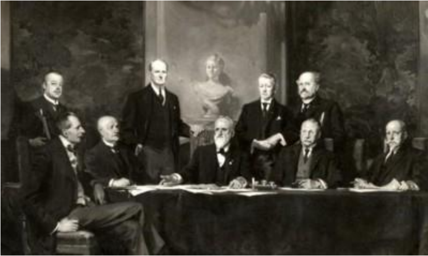
Kabinet Cort van der Linden

normale politieke kabinetten niet voor elkaar kregen, is er tegenwoordig nog steeds een roep naar een zakenkabinet als er weer een kabinetsformatie heel lang duurt, of dat door verdeeldheid van de politieke partijen de politiek besluiteloos is.