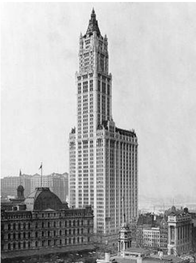
Woolworths Building New York

industrie nog steeds actueel, alleen is de mens voor een deel vervangen door robots. Nog een verschil met de productie van auto's in 1913 is dat de productie van auto's nu volledig afgestemd is op de wens van de klant. Er wordt hoofdzakelijk op bestelling geproduceerd. Ford kon echter in zijn tijd bij de T-Ford nog stellen dat de klant alle kleuren kon kiezen "als deze maar zwart is".